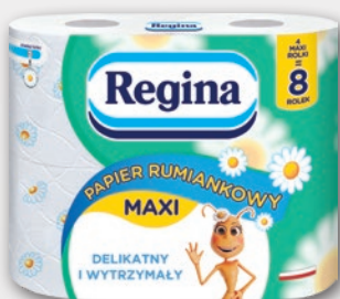
REGINA PAPIER TOALETOWY 4 ROLKI • dwa rodzaje 319737