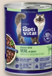
OPTI VITAL KARMA DLA KOTA 415 G • wszystkie rodzaje 4522