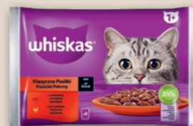
WHISKAS KARMA DLA KOTA 4 x 85 G • wszystkie rodzaje 857977