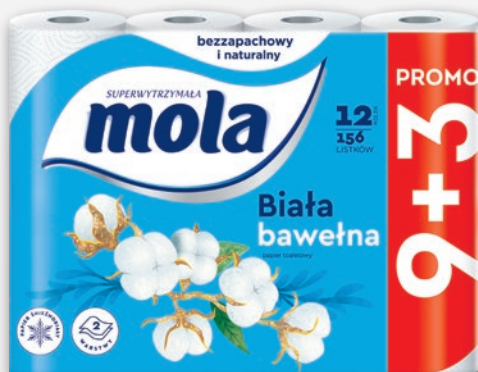
MOLA PAPIER TOALETOWY 9 + 3 ROLKI 372774