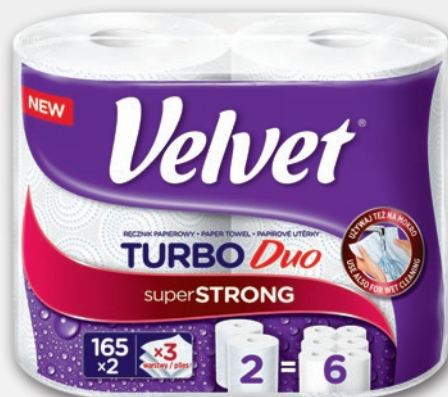
VELVET TURBO DUO RĘCZNIK 2 ROLKI 696259