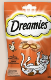
DREAMIES PRZEKĄSKA DLA KOTA 60 G • wszystkie rodzaje 377352