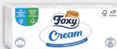
FOXY CHUSTECZKI 10 x 10 SZT. 401226