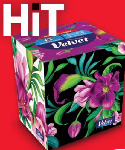
VELVET CHUSTECZKI 56 SZT. 408121