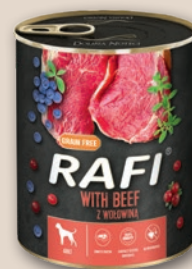
RAFI KARMA DLA PSA 800 G • wszystkie rodzaje 201385