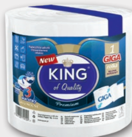
KING RĘCZNIK 1 ROLKA 365956