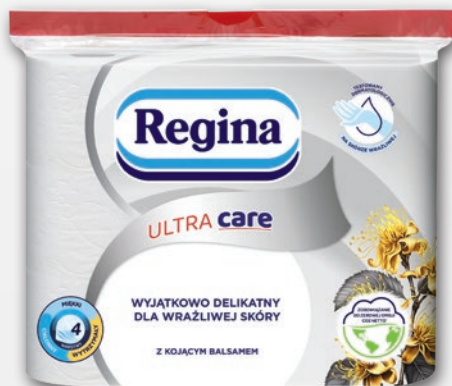
REGINA PAPIER TOALETOWY 9 ROLEK • dwa rodzaje 300902