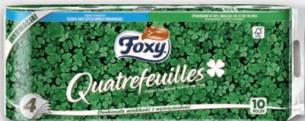
FOXY PAPIER TOALETOWY 10 ROLEK 622100