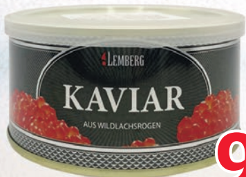
KAWIOR Z ŁOSOSIA GORBUSZA 300 G 289502