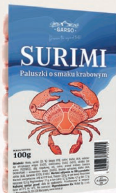
PALUSZKI SURIMI 100 G 675098