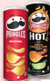
CHIPSY PRINGLES 165 G • wybrane rodzaje 49071