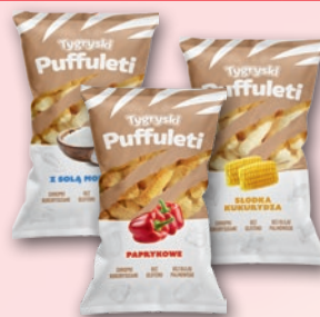
CHRUPKI TYGRYSKI PUFFULETI 85 G • wszystkie rodzaje 676263