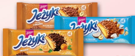
CIASTKA JEZYKI 140 G • wszystkie rodzaje 237245