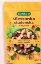
MIESZANKA STUDENCKA 400 G 690603