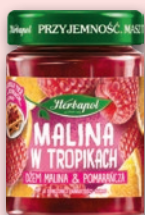
DŻEM 280 G 473196