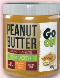
KREM ORZECHOWY 100% 500 G • crunchy, smooth 217414