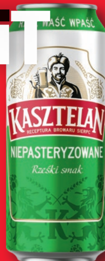
PIWO KASZTELAN 500 ML • + kaucja 0.50 zł 547978