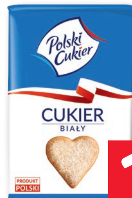
CUKIER BIAŁY 1 KG 1027526