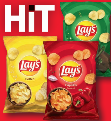
CHIPSY LAY'S 110-163 G • wszystkie rodzaje 816948