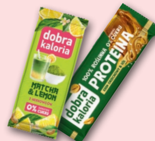
BATON DOBRA KALORIA 35-45 G • wybrane rodzaje 600475