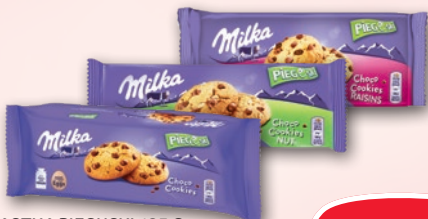
CIASTKA PIEGUSKI 135 G • wszystkie rodzaje 415703