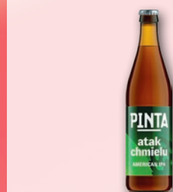
PIWO ATAK CHMIELU 500 ML 554118

CENA TYLKO DLA CIEBIE NALICZANA PRZY KASIE