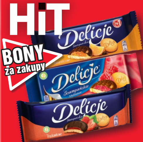
DELICJE SZAMPAŃSKIE 147 G • wszystkie rodzaje 35066