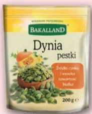
PESTKI DYNI ŁUSKANE 200 G 273432