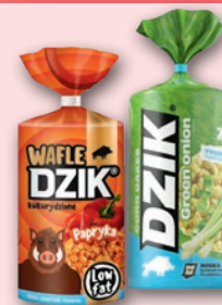
WAFLE KUKURYDZIANE DZIK 120 G • paprykowe, zielona cebulka 76993