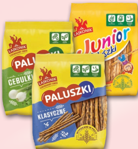
PALUSZKI LAJKONIK 150-200 G • wszystkie rodzaje 93991