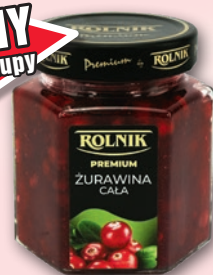
ŻURAWINA 300 G 645338