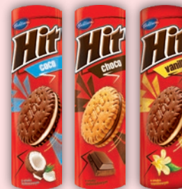
MARKIZY HIT 220 G • wszystkie rodzaje 12065