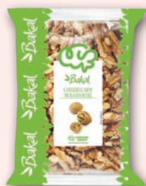
ORZECHY WŁOSKIE 300 G 570760