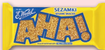
SEZAMKI AHA! 27,2 G 548217