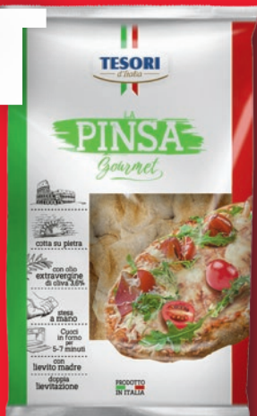
PINSA 230 G • pszenna, pełnoziarnista • cena promocyjna za 1 szt.: 10.99 , z VAT 11.54 • najniższa cena towaru w okresie 30 dni przed wprowadzeniem obniżki za 1 szt.: 14.99 , z VAT 15.74 819693