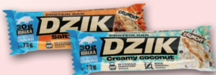
BATON PROTEINOWY DZIK SŁONY KARAMEL 73 G • w promocji również baton proteinowy Dzik kokos 73 g w cenie: 6.47 , z VAT 6.99 602835