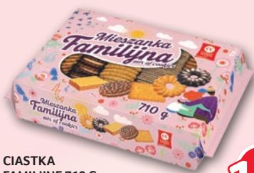
CIASTKA FAMILIJNE 710 G 510874