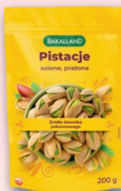
PISTACJE PRAŻONE 200 G 926446

CENA TYLKO DLA CIEBIE NALICZANA PRZY KASIE