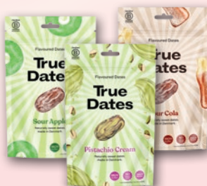
DAKTYLE TRUE DATES 100 G • wszystkie rodzaje 403932