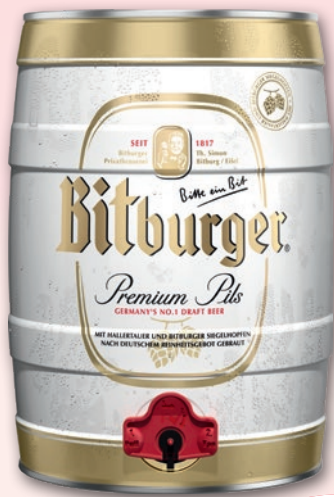
PIWO BITBURGER 5 L 178563