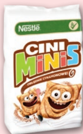
PŁATKI ŚNIADANIOWE 350-450 G • wybrane rodzaje 369763