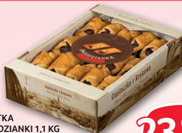
CIASTKA JAGODZIANKI 1,1 KG 617789