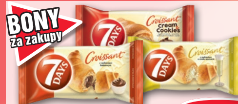
ROGAL 7DAYS 60 G • wszystkie rodzaje 601651