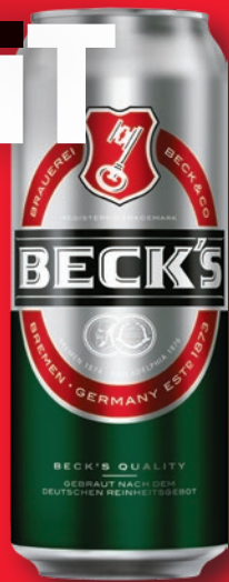
PIWO BECK'S 500 ML • + kaucja 0.50 zł 684330