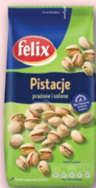
PISTACJE FELIX 360 G 968497