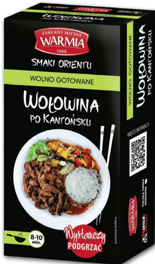
WOŁOWINA WOLNO GOTOWANA PO KANTOŃSKU 300 G 319378