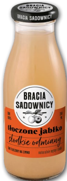
SOK BRACIA SADOWNICY 250 ML • wszystkie rodzaje 601337