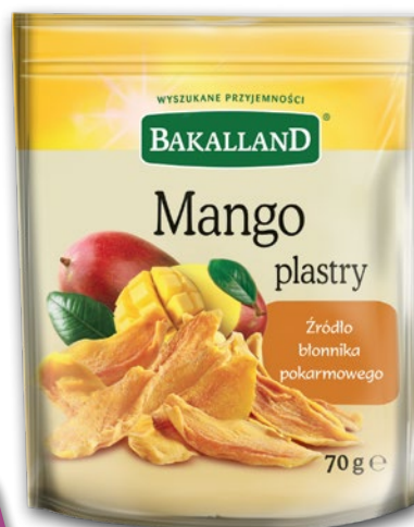
MANGO SUSZONE 70 G 703790