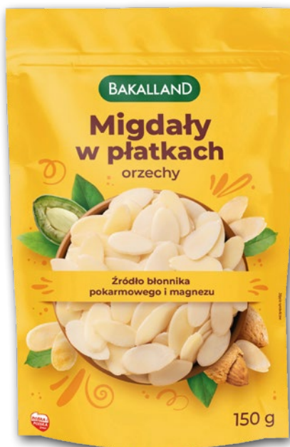
MIGDAŁY W PŁĄTKACH 150 G 776500