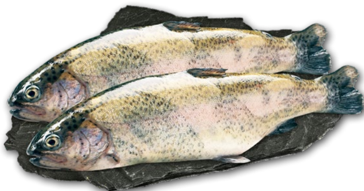
PSTRĄG TĘCZOWY PATROSZONY 800 G+ • cena za 1 kg: 29.90, z VAT 31.40 561131