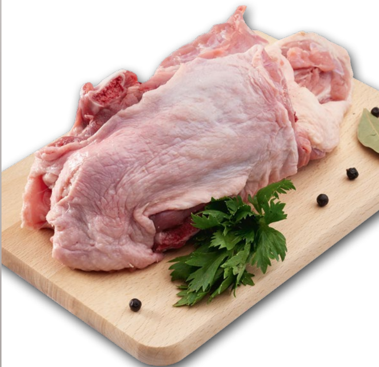
PORCJA ROSOŁOWA Z KACZKI PEKIN OK. 0,8 KG 355117