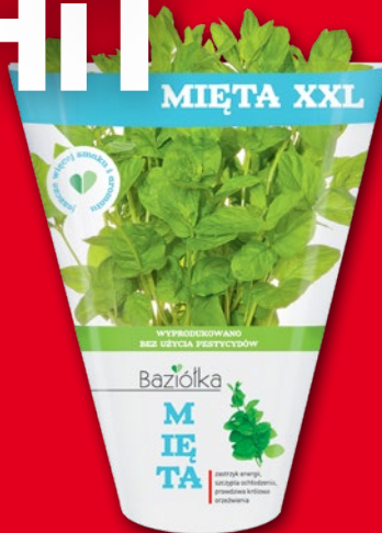
MIĘTA XXL DONICZKA • cena przed obniżką za 1 opak.: 9.99, z VAT 10.49 415182