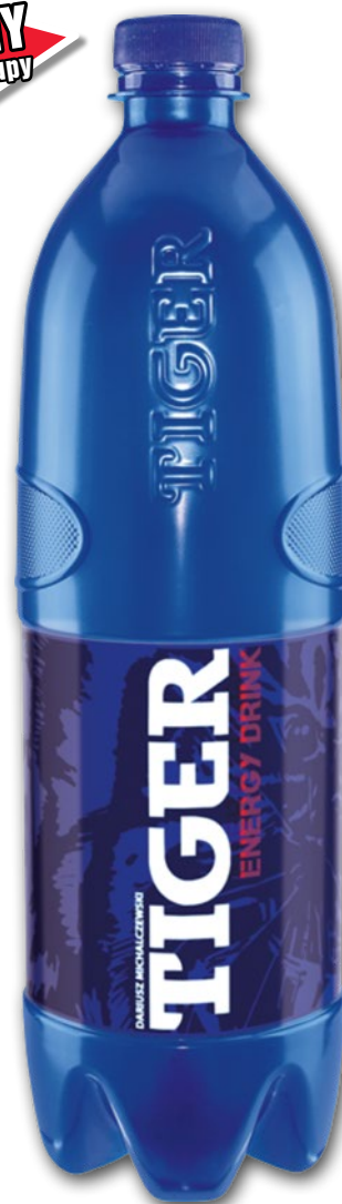
NAPÓJ ENERGETYCZNY TIGER 900 ML • + kaucja 0.50 zł 507145