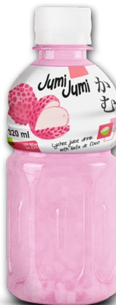
NAPÓJ JUMI JUMI 320 ML • wszystkie rodzaje 951912