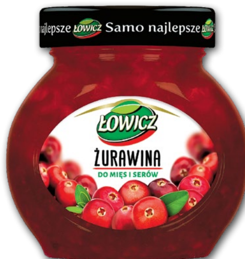
ŻURAWINA DO MIĘS I SERÓW 230 G 289310