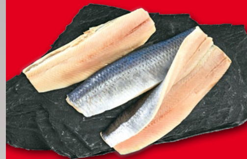
ŚLEDŹ PŁAT • cena za 1 kg: 17.90, z VAT 18.80 575932