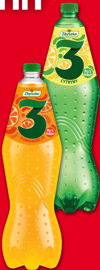
NAPÓJ ZBYSZKO 1,75 L • wszystkie rodzaje • + kaucja 0.50 zł 510914