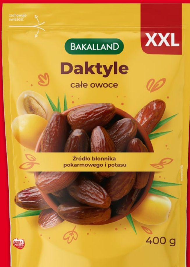
DAKTYLE DRYLOWANE 400 G 981