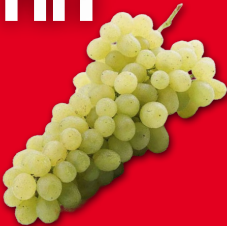
WINOGRONA BIAŁE BEZPESTKOWE 976348