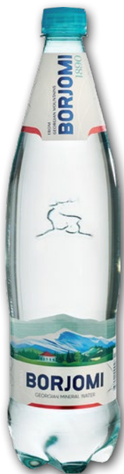
WODA BORJOMI 1 L 740485