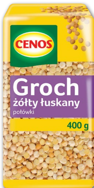
GROCH ŻÓŁTY ŁUSKANY POŁÓWKI 400 G 101354