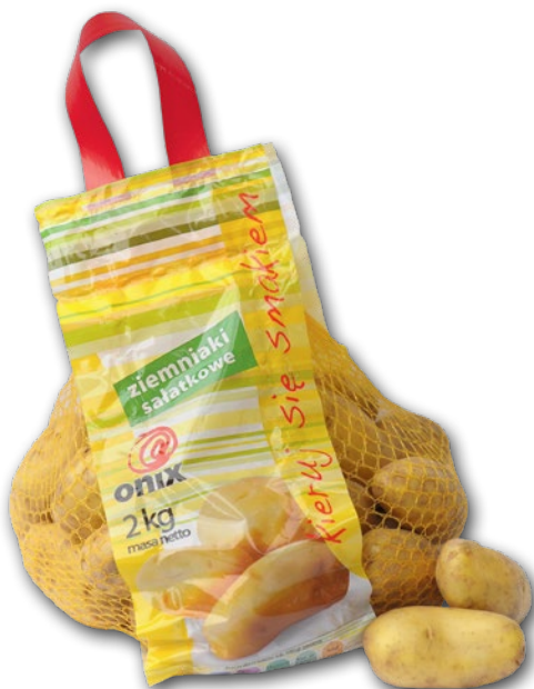
ZIEMNIAKI JADALNE MYTE SALATKOWE 2 KG 689667