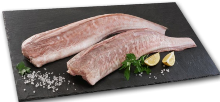
MIĘTUS KRÓLEWSKI TUSZA • cena za 1 kg: 45.90, z VAT 48.20 33468