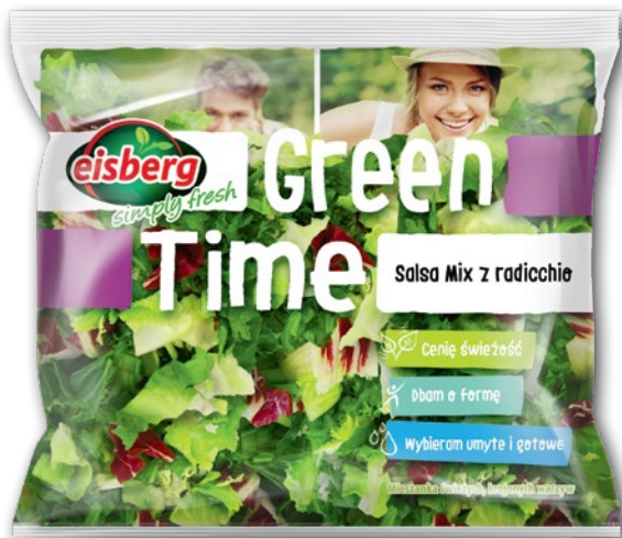
SALAATKA SALSA MIX Z RADICCHIO 150 G 771024