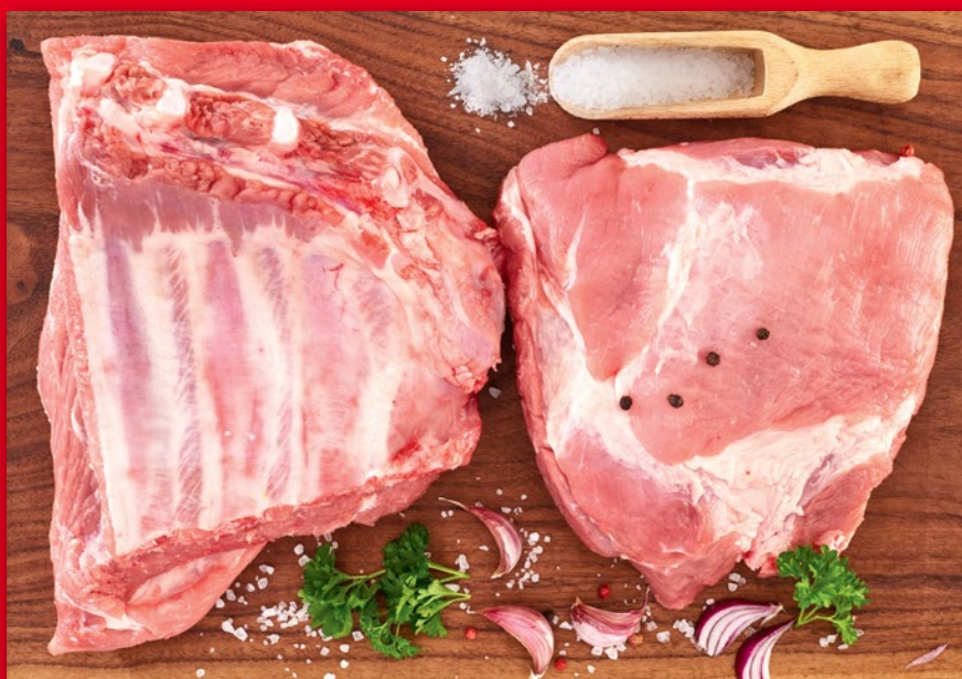
ŻEBERKA WIEPRZOWE TRÓJKĄTY MAŁA PORCJA 195000