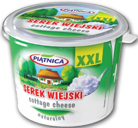
SEREK WIEJSKI 500 G • serek wiejski lekki 500 g również w promocyjnej cenie 211778