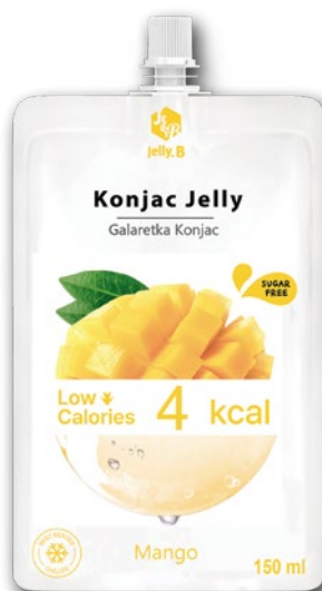
GALARETKA JELLY 150 ML 925042