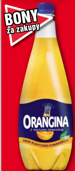
NAPÓJ ORANGINA 1,4 L • + kaucja 0.50 zł 509295