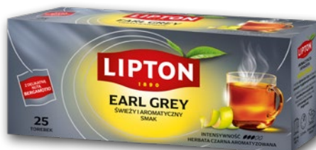
HERBATA EKSPRESOWA LIPTON 25 TOREBEK • wybrane rodzaje 158050