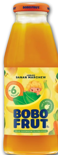
NEKTAR 300 ML • wszystkie rodzaje 869043