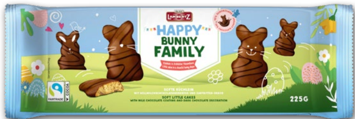
CIASTKA HAPPY BUNNY FAMILY LAMBERTZ 225 G 224523