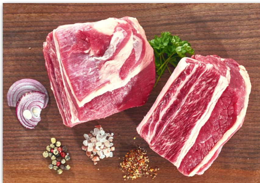
SZPONDER WOŁOWY Z KOŚCIĄ MAŁA PORCJA 763549