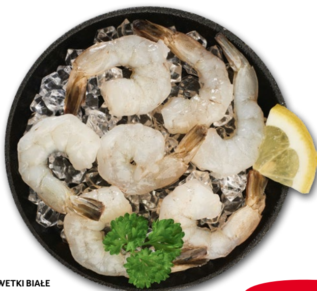
KREWETKI BIAŁE SUROWE OBRANE 30-40 • cena za 1 kg: 59.90, z VAT 73.68 288643