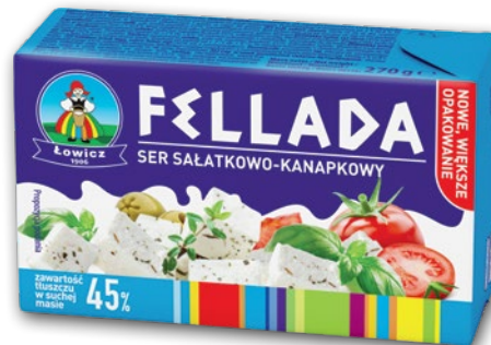
SER FELLADA 45% 270 G 914945