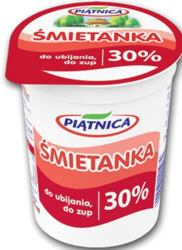
ŚMIETANKA 30% 400 G 279654