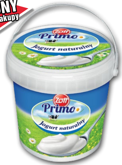
JOGURT NATURALNY 1 KG 611155