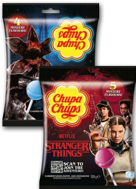
LIZAK CHUPA CHUPS STRANGER THINGS 10 x 12 G • wybrane rodzaje 479577