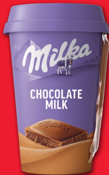
NAPÓJ MILKA 220 ML • wszystkie smaki • cena promocyjna za 1 szt.: 4.99, z VAT 5.24 • najniższa cena towaru w okresie 30 dni przed wprowadzeniem obniżki za 1 szt.: 5.99, z VAT 6.29 831575