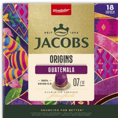
KAWA W KAPSUŁAKACH 18-20 SZTUK JACOBS ORIGINS • wybrane rodzaje 294301