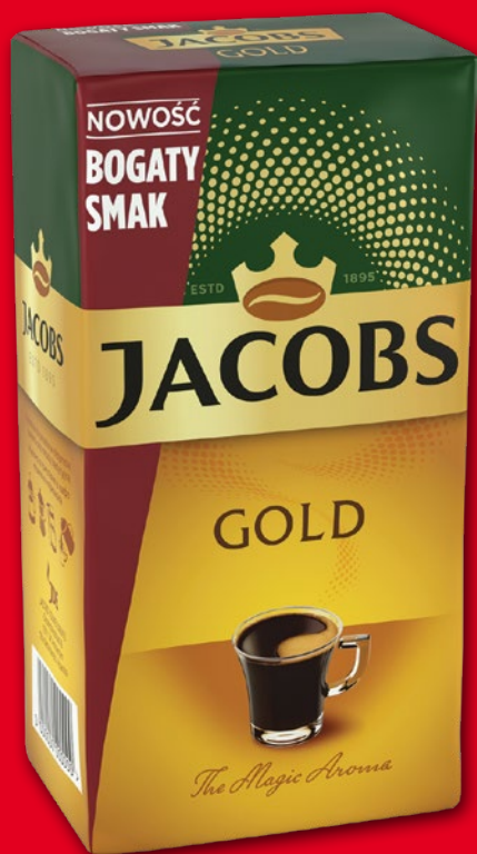
KAWA MIELONA JACOBS GOLD 500 G 790752