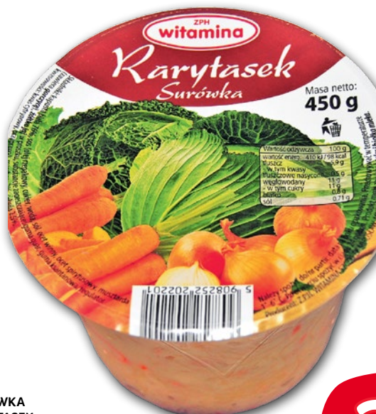
SURÓWKA RARYTASEK 450 G 687803