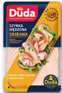
SZYNKA DROBIOWA PLASTRY 100 G • wybrane rodzaje 287550

CENA TYLKO DLA CIEBIE NALICZANA PRZY KASIE