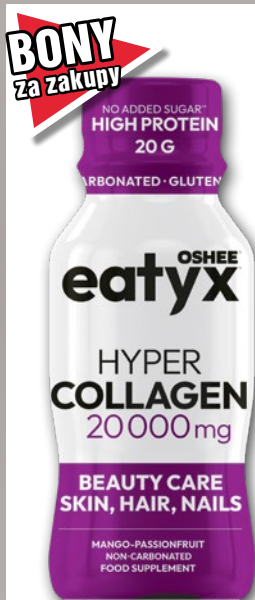
NAPÓJ EATYX OSHEE 95 ML • wszystkie rodzaje 230081