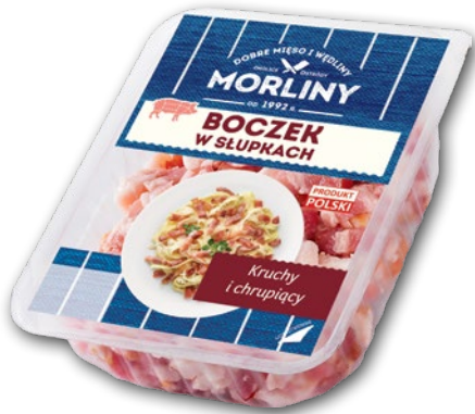
BOCZEK W SŁUPKACH 130 G 686969