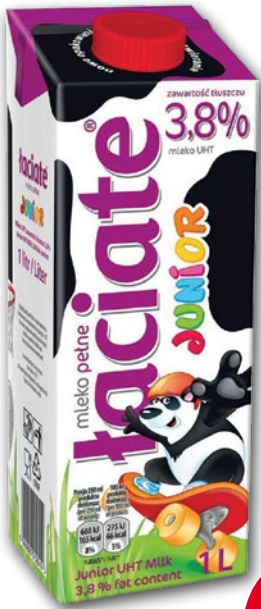
MLEKO JUNIOR UHT 3,8% 1 L 688283