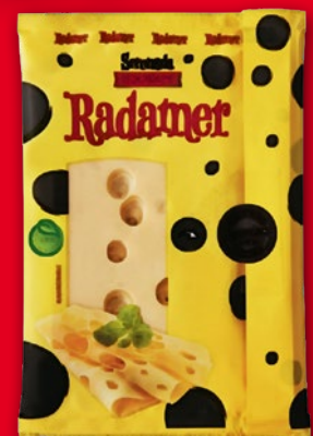
SER PLASTRY 135 G • wszystkie rodzaje 760001