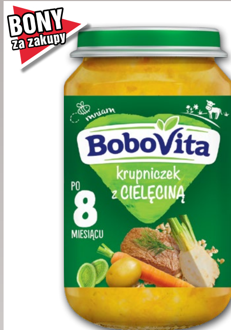
OBIADEK 190 G • wszystkie rodzaje • w promocyjnej cenie również deserki 190 g 741969