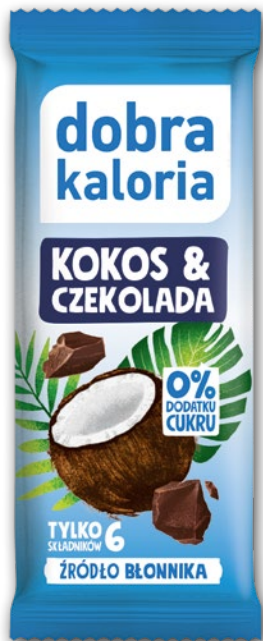
BATON DOBRA KALORIA KOKOS/ CZEKOLADA 33 G 535642