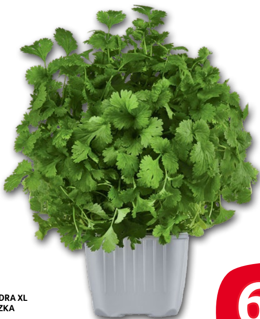
KOLENDRA XL DONICZKA 806757