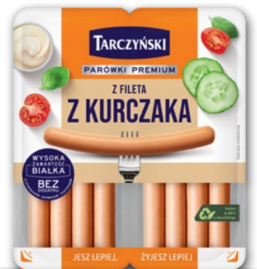
PARÓWKI Z FILETA 180 G 556306

CENA TYLKO DLA CIEBIE NALICZANA PRZY KASIE