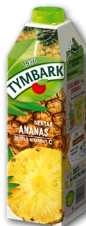
NEKTAR TYMBARK ANANAS 1 L 75200