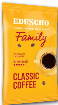
KAWA MIELONA FAMILY 100 G 477983