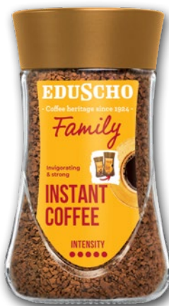
KAWA ROZPUSZCZALNA FAMILY 100 G 571075

CENA TYLKO DLA CIEBIE NALICZANA PRZY KASIE