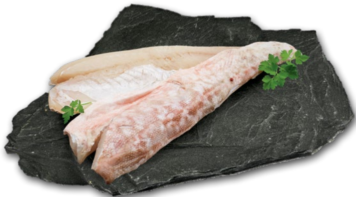
MIĘTUS KRÓLEWSKI FILET ZE SKÓRĄ • cena za 1 kg: 55.90, z VAT 58.70 626876