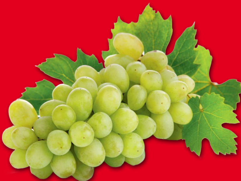
WINOGRONA BIAŁE BEZPESTKOWE • cena przed obniżką za 1 kg: 17.99, z VAT 18.89 569784