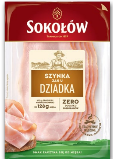
WĘDLINA JAK U DZIADKA PLASTRY 100 G • wszystkie rodzaje 642049