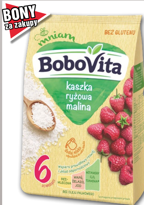
KASZKA 230 G • wszystkie rodzaje 40347