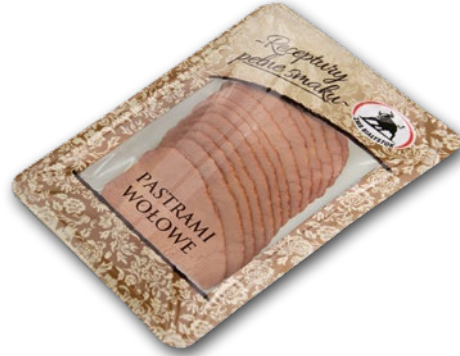
PASTRAMI WOŁOWE PLASTRY 100 G 208842

CENA TYLKO DLA CIEBIE NALICZANA PRZY KASIE