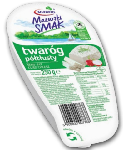
TWARÓG 250 G • wszystkie rodzaje 566371