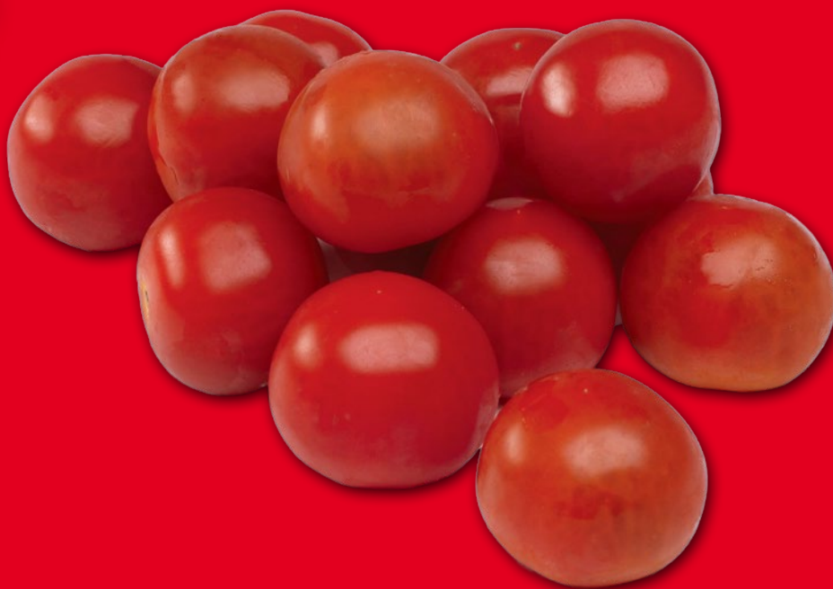
POMIDOR CHERRY CZERWONY • cena przed obniżką za 1 kg: 16.99, z VAT 17.84 721874