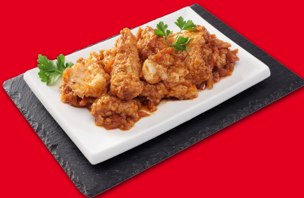
RYBA PO GRECKU • cena za 1 kg: 15.90, z VAT 16.70 578310