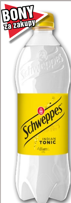
NAPÓJ SCHWEPES 850 ML • + kaucja 0.50 zł • wszystkie rodzaje 587835

CENA TYLKO DLA CIEBIE NALICZANA PRZY KASIE