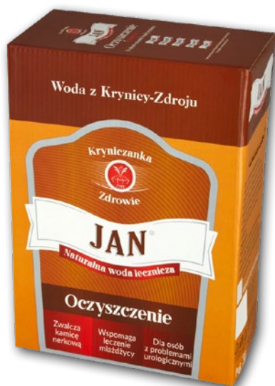
WODA LECZNICZA JAN Z KRYNICY 3 L 302324