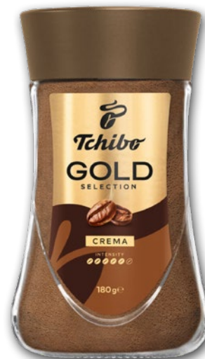
KAWA ROZPUSZCZALNA GOLD CREMA TCHIBO 180 G 150934

CENA TYLKO DLA CIEBIE NALICZANA PRZY KASIE