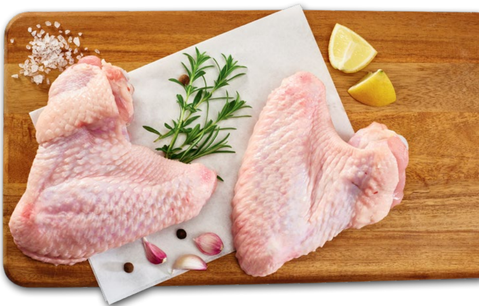
SKRZYDŁO Z INDYKA OK. 0,8 KG 266146