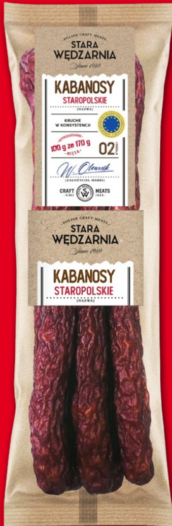
KABANOSY STAROPOLSKIE 170 G 586717