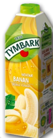
NEKTAR TYMBARK BANAN 1 L 591667