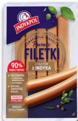
PARÓWKI FILETKI Z INDYKA 200 G 214649