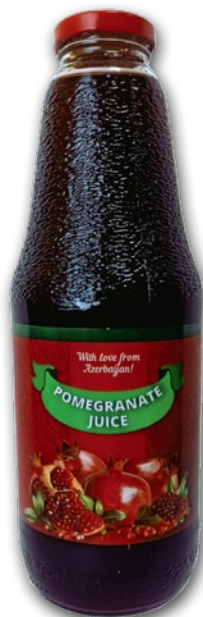
SOK Z GRANATU 1 L 967340