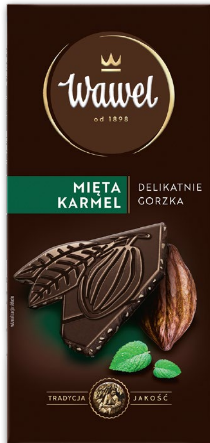
CZEKOLADA PREMIUM WAWEL 90 G • wszystkie rodzaje 463044