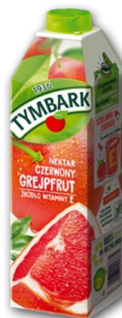
NEKTAR TYMBARK CZERWONY GREJPFRT 1 L 511022