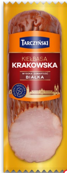
KIEŁBASA KRAKOWSKA 320 G 398138