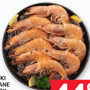
KREWETKI GOTOWANE 40-60 BOX opakowanie ok. 2 kg 934944