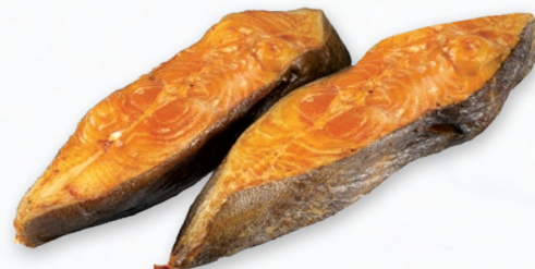
HALIBUT KAWAŁKI WĘDZONE NA GORĄCO BOX opakowanie ok. 3 kg 656760