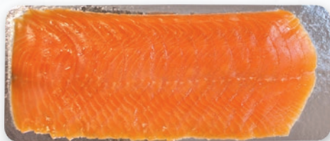
ŁOSOŚ WĘDZONY PLASTRY OK. 1 KG 884545