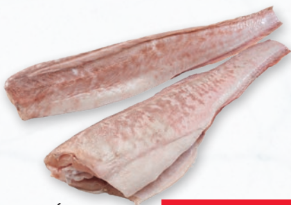
MIĘTUŚ KRÓLEWSKI TUŚZA BOX opakowanie ok. 3 kg 211579