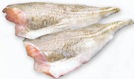
DORSZ ATLANTYCKI FILET ZE SKÓRĄ BOX opakowanie ok. 5 kg 391842