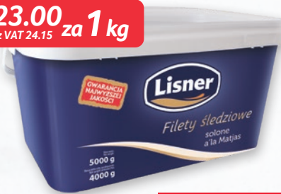
FILETY ŚLEDZIOWE A'LA MATJAS 4 KG 539741