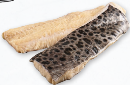
ZĘBACZ FILET ZE SKÓRĄ BOX opakowanie ok. 5 kg 164730