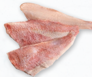
KARMAZYN FILET ZE SKÓRĄ BOX opakowanie ok. 5 kg 901578