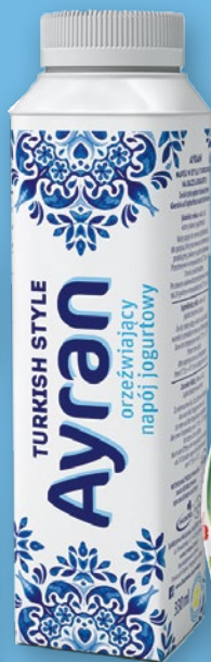
NAPÓJ TURECKI 330 G 862859