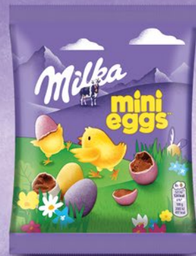
JAJKA MILKA MINI 97 G 626482