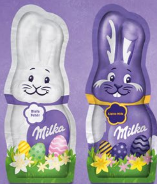
FIGURKA CZEKOLADOWA MILKA BUNNY 45 G • wszystkie rodzaje 126239