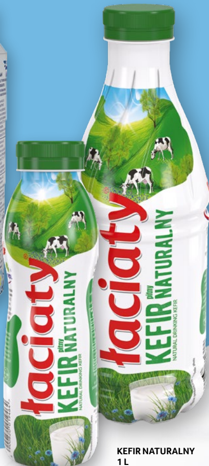
KEFIR NATURALNY 360 G 718280