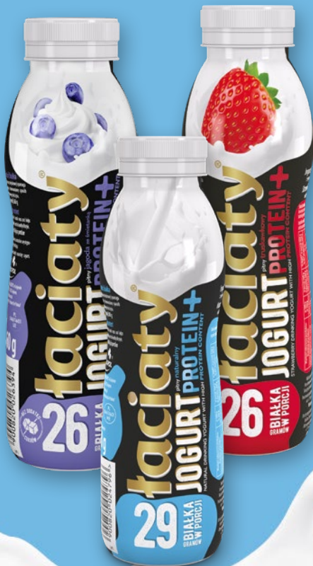
JOGURT PITNY PROTEINOWY 360 G • wszystkie smaki 962479