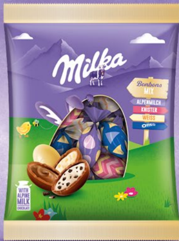
CUKIERKI MILKA EASTER 130 G 341566