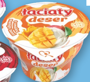
DESER 170 G • wszystkie smaki 681976