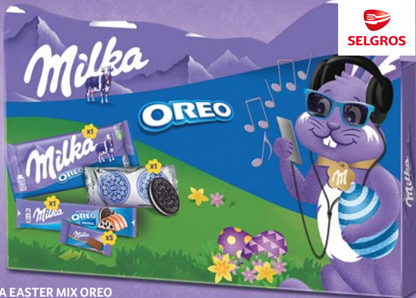
MILKA EASTER MIX OREO 182 G 871398