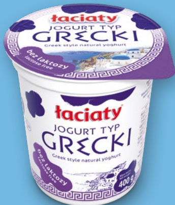
JOGURT TYP GRECKI NATURALNY BEZ LAKTOZY 400 G 710144