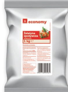
ŻELATYNA SPOŻYWCZA 1 KG 962862