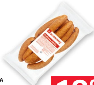
KIEŁBASA ŚLĄSKA OK. 1,2 KG 146222