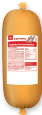
SZYŃKA KONSERWOWA OK. 3,5 KG 205240