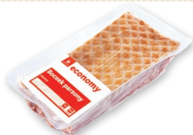
BOCZEK WĘDZONY PARZONY PŁASTRY 93% OK. 1 KG 211429