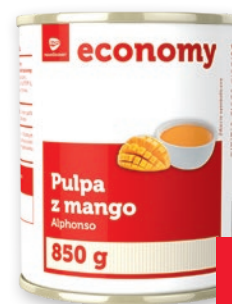
PULPA Z MANGO 850 G