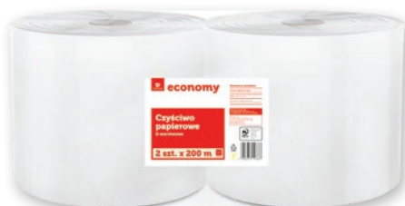
CZYŚCIWO 2-WARSTWOWE 2 ROLKI x 200 M