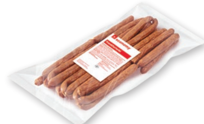
FRANKFURTERKI WĘDZONE PARZONE OK. 1 KG 109864