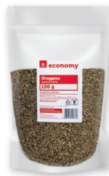
OREGANO SUSZONE OTARTE 150 G