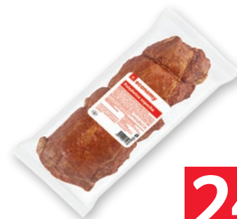
POLEDWICA SOPOČKA OK. 2,5 KG 852650