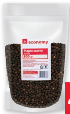
PIEPRZ CZARNY ZIARNO 800 G