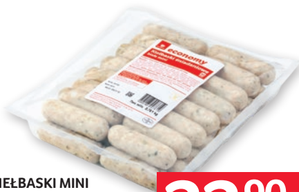
KIEŁBASKI MINI OK. 0,73 KG wszystkie rodzaje 563001