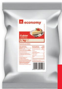
CUKIER WANILINOWY 1 KG