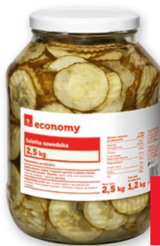
SALAŃKA SZWEDZKA 2,5 KG