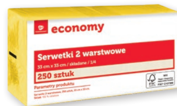
SERWETKI 2-WARSTWOWE 33 x 33 CM 250 SZT. wszystkie rodzaje