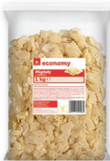
MIGDAŁY W PŁATKACH 1 KG