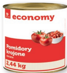
POMIDORY 2,44 KG krojone, w całości