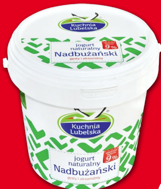
JOGURT NADBUŻAŃSKI 1 KG • najniższa cena towaru w okresie 30 dni przed wprowadzeniem obniżki za 1 szt.: 10.45 , z VAT 10.97 482362