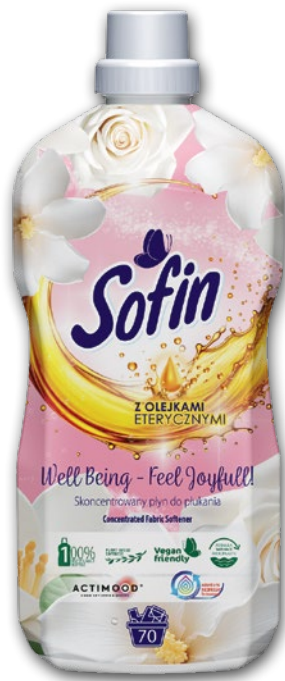
SOFIN PŁYN DO PŁUKANIA 1,4 L • wszystkie rodzaje 244034