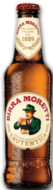
PIWO BIRRA MORETTI 330 ML 693761