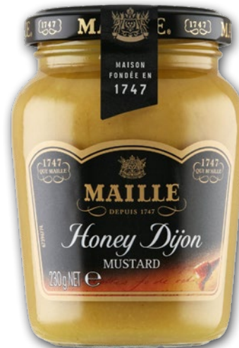
MUSZTARDA MIODOWA 230 G 321219