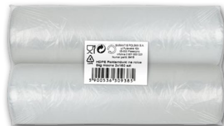
HDPE REKLAMÓWKI NA ROLCE 2 x 160 SZT. 313880

10 99 1 opak. z VAT 13.52 CENA TYLKO DLA CIEBIE NALICZANA PRZY KASIE