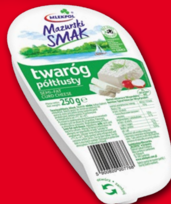
TWAROŻEK KLINEK 250 G • wszystkie rodzaje 566371