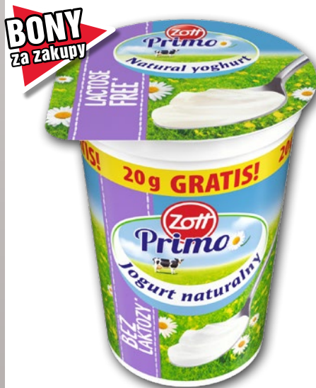
JOGURT NATURALNY BEZ LAKTOZY 180 + 20 G 574651