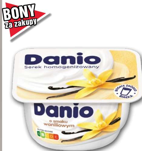
SEREK 130 G • wszystkie smaki 72757