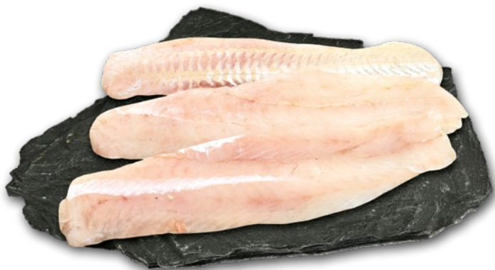
MORSZCZUK FILET BEZ SKÓRY