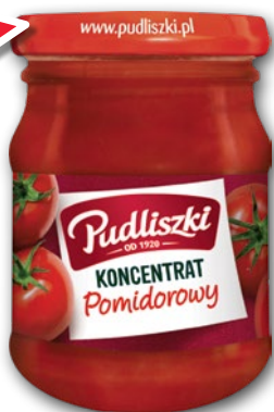
KONCENTRAT POMIDOROWY 90 G 277143