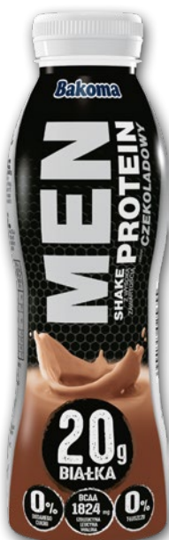
JOGURT MEN SHAKE 380 G • wszystkie rodzaje 412345