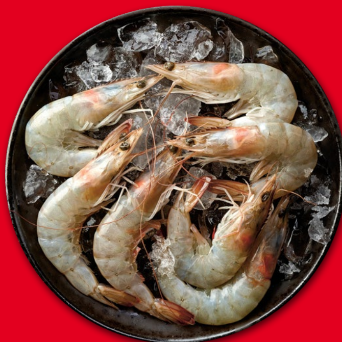
KREWETKI BIAŁE SUROWE 30-40

• cena za 1 kg: 47.90, z VAT 58.92 • cena przed obniżką za 1 kg: 59.99, z VAT 73.79