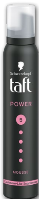
TAFT PIANKA DO WŁOSÓW 200 ML • wybrane rodzaje 173496