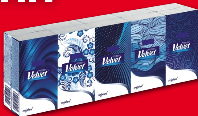
VELVET CHUSTECZKI HIGIENICZNE 10 x 10 SZT. • dwa rodzaje • najniższa cena towaru w ciągu 30 dni przed wprowadzeniem obniżki za 1 zest.: 6.39, z VAT 7.86 180854