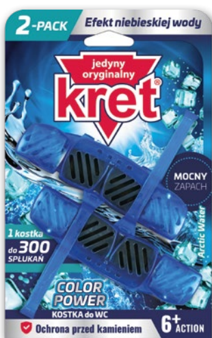
KRET ZAWIESZKA DO WC 2 x 40 G • wszystkie rodzaje 122571