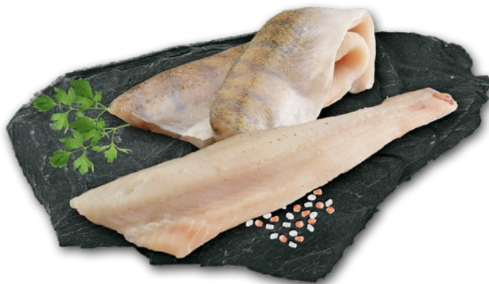
SANDACZ FILET ZE SKÓRĄ