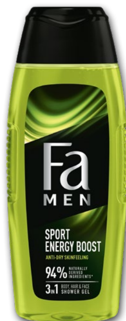
FA ŻEL POD PRYSZNIC 400 ML • wybrane rodzaje 435037