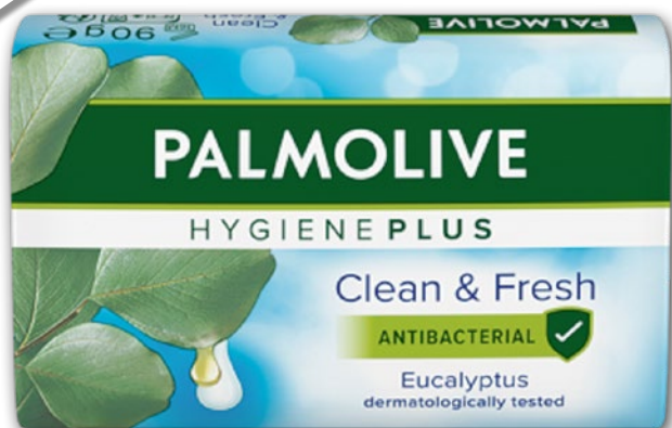
PALMOLIVE HYGIENE PLUS MYDŁO 90 G • dwa rodzaje 808712