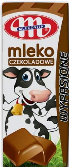
MLEKO SMAKOWE UHT 200 ML • wszystkie smaki 596044