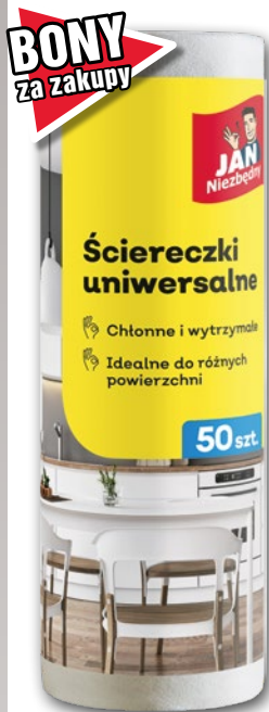
JAN NIEZBĘDNY ŚCIERECZKI W ROLCE 50 SZT. • dwa rodzaje 380199

10 99 1 opak. z VAT 13.52 CENA TYLKO DLA CIEBIE NALICZANA PRZY KASIE