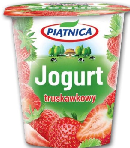
JOGURT OWOCOWY 150 G • wszystkie smaki 475737