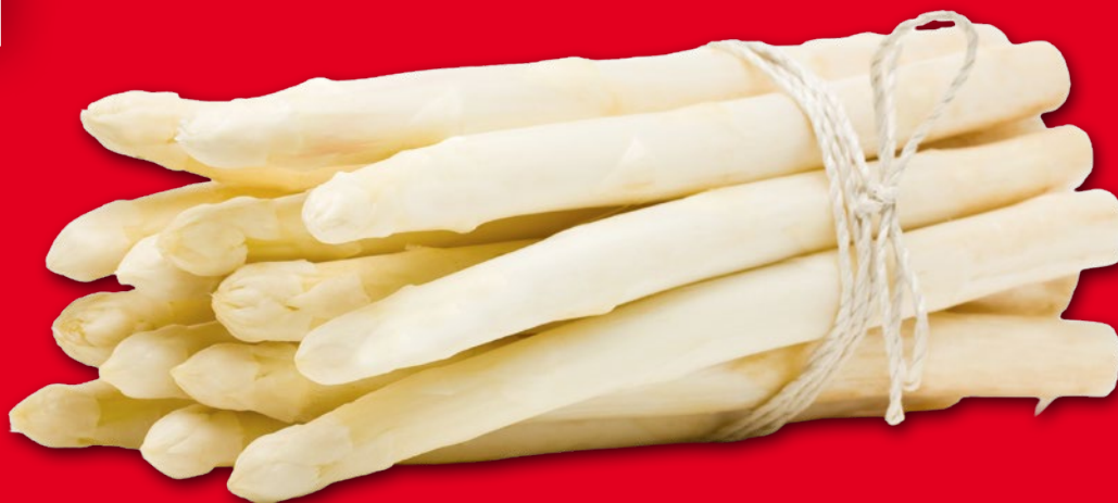
SZPARAGI BIAŁE 500 G • cena przed obniżką za 1 opak.: 16.99, z VAT 17.84 936864