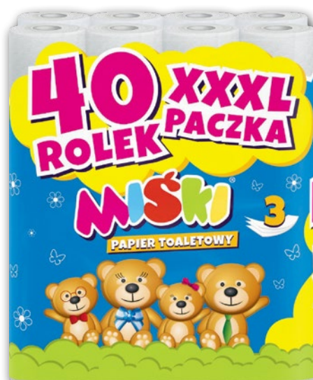
MIŠKI PAPIER TOALETOWY 40 SZT. 867438