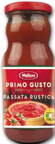
PASSATA POMIDOROWA RUSTICA 350 G 425495

CENA TYLKO DLA CIEBIE NALICZANA PRZY KASIE