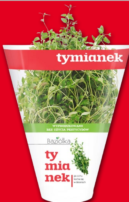
TYMIANEK DONICZKA 1 SZT. • cena przed obniżką za 1 opak.: 7.99, z VAT 8.39 700609