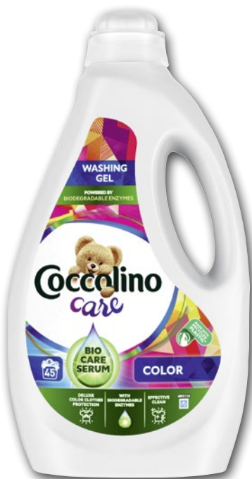
COCCOLINO ŻEL DO PRANIA 1,8 L • wszystkie rodzaje 713394