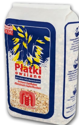
PŁATKI GÓRSKIE 500 G • górskie białkawe i owsiane 235894