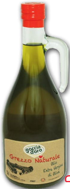
OLIWA 1 L 589597