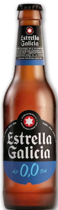
PIWO ESTRELLA GALICIA 0% 330 ML 972422