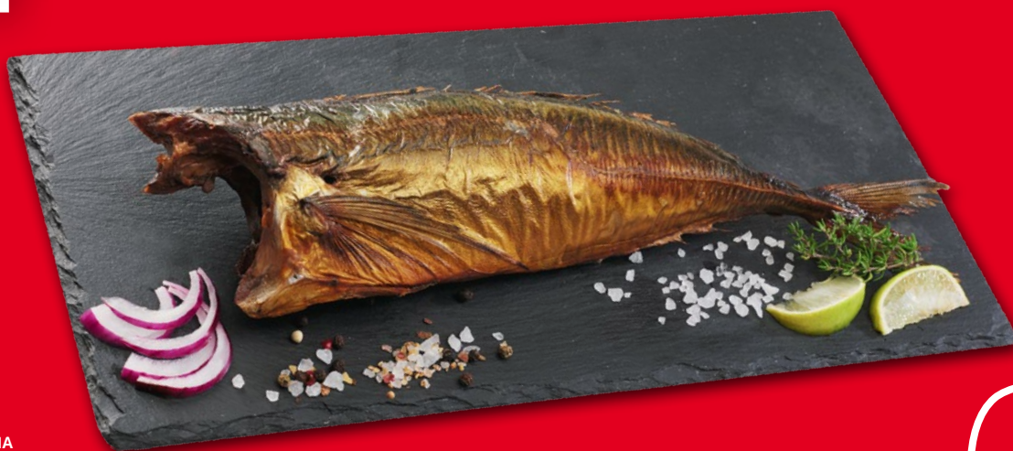
OSTROBOK TUSZA WĘDZONA