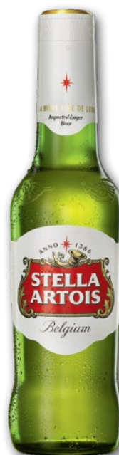
PIWO STELLA ARTOIS 330 ML 616645

*12 szt. w cenie 6 szt. Limit 36 szt. na Klienta na dzień. Cena regularna za 1 szt.: 3.48, z VAT 4.28. Rabat zostanie naliczony przy kasie.