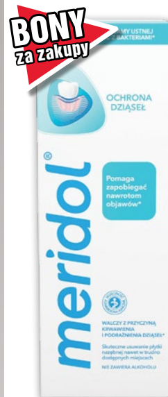
MERIDOL PŁYN DO PŁUKANIA JAMY USTNEJ 400 ML 150679