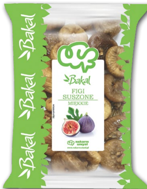
FIGI SUSZONE 500 G 908311