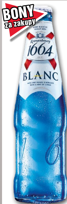
PIWO 1664 BLANC 330 ML 650881