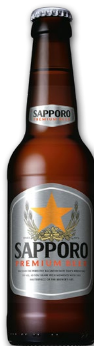
PIWO SAPPORO 330 ML 700543

CENA TYLKO DLA CIEBIE NALICZANA PRZY KASIE