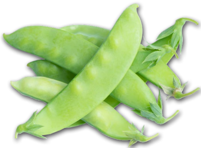
GROSZEK CUKROWY 250 G 884685