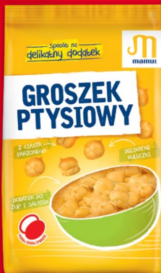
GROSZEK PTYSIOWY 80 G 323338