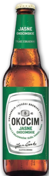
PIWO OKOCIM JASNE PEŁNE 500 ML • + kaucja 0.50 zł • wszystkie rodzaje 24113