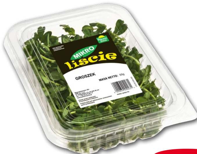
MIKROLIŚCIE GROSZKU 50 G 432791