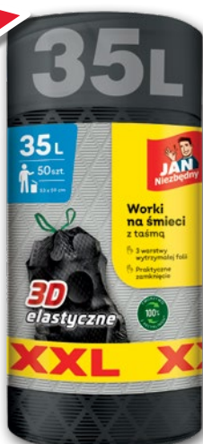
JAN NIEZBĘDNY MAGNUM WORKI NA ŚMIECI 35 L x 50 SZT. 654945