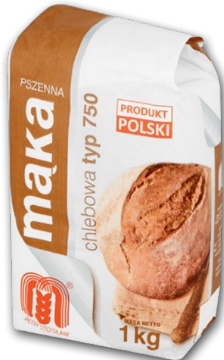
MAKA PSZENNA 1 KG 636728