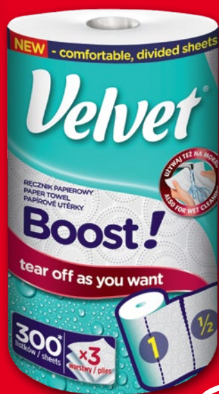
VELVET BOOST! RĘCZNIK PAPIEROWY 1 ROLKA • najniższa cena towaru w ciągu 30 dni przed wprowadzeniem obniżki za 1 opak.: 12.19, z VAT 14.99 126200