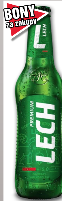
PIWO LECH PREMIUM 330 ML 551651