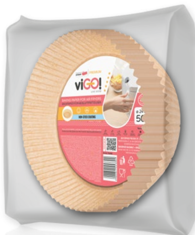
VIGO PAPIER DO PIECZENIA DO FRYTOWNIC BEZTŁUSZCZOWYCH 24 CM x 50 SZT. 121316