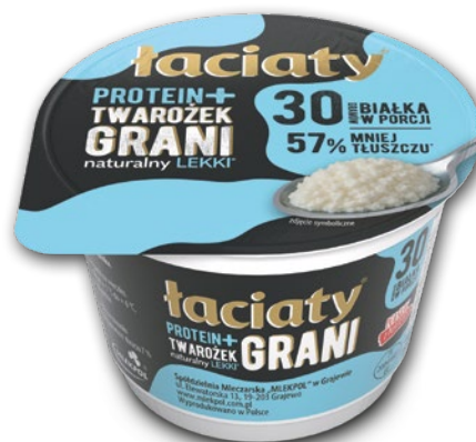
TWAROŻEK LEKKI PROTEINOWY 200 G 487076