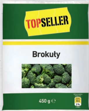
BROKUŁY 450 G 818946