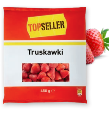
TRUSKAWKI 450 G 694730