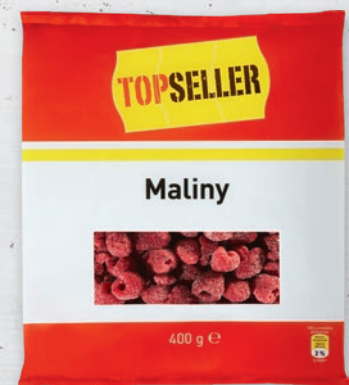
MALINY 400 G 322292