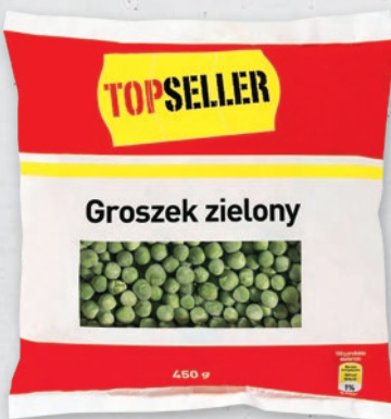
GROSZEK ZIELONY 450 G 255352