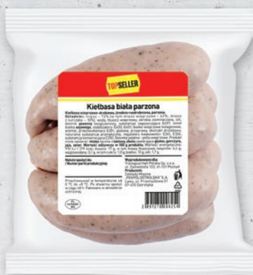
KIEŁBASA BIAŁA PARZONA 600 G 423974