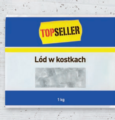
LÓD W KOSTKACH 1 KG 981631