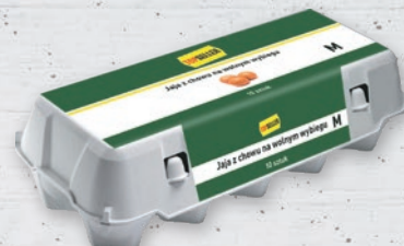
JAJA Z CHOWU NA WOLNYM WYBIEGU ROZMIAR M • sprzedaż po 10 szt. 516283