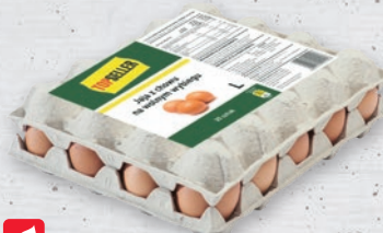
JAJA Z CHOWU NA WOLNYM WYBIEGU ROZMIAR L • sprzedaż po 20 szt. 37023