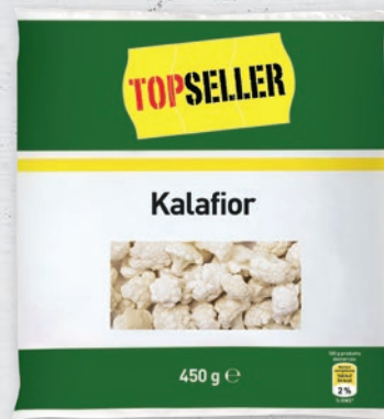
KALAFIOR 450 G 654299