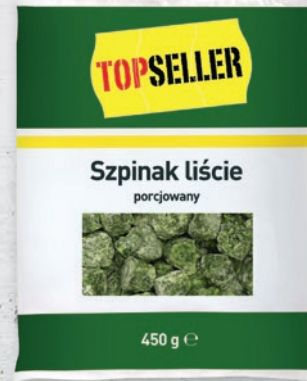
SZPINAK LIŚCIE 450 G 93659