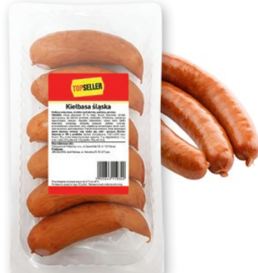
KIEŁBASA ŚLĄSKA 500 G 667415