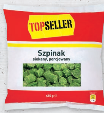
SZPINAK SIEKANY 450 G 130300